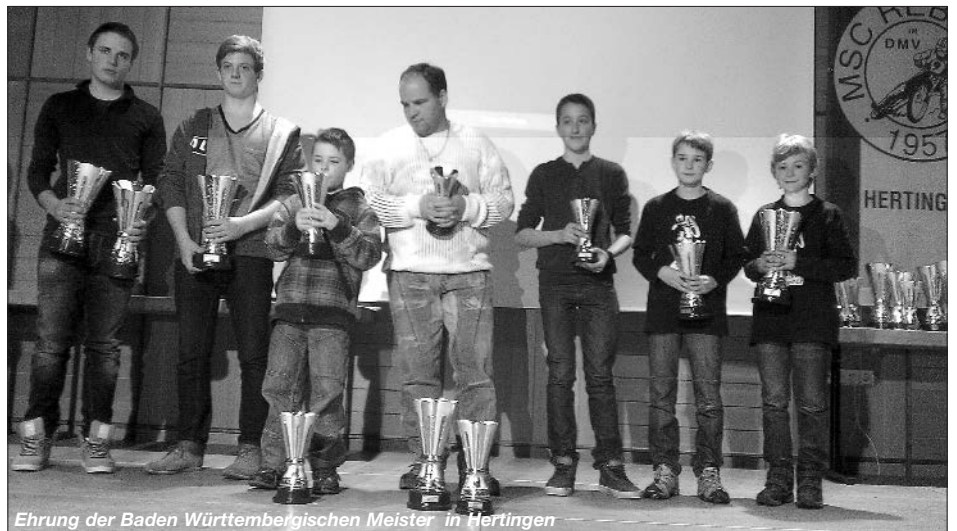
Ehrung der Baden Württembergischen Meister in Hertingen