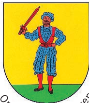
Ortsteil Bad Bellingen