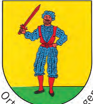
Ortsteil Bad Bellingen