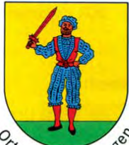
Ortsteil Bad Bellingen