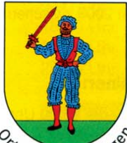
Ortsteil Bad Bellingen