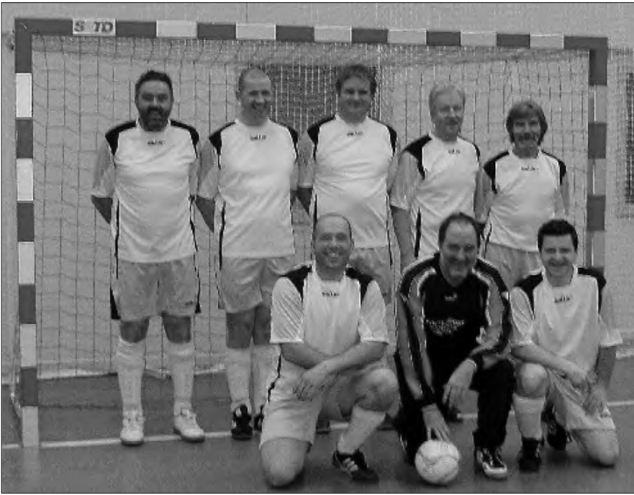
Die AH-Truppe in unserer Partnergemeinde Petit Landau.