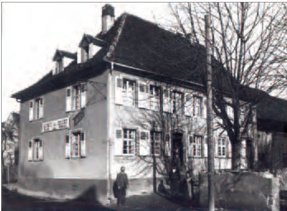
Das ehemalige Gasthaus „Hirschen“ im heutigen Schloßpark, Aufnahme von 1893.