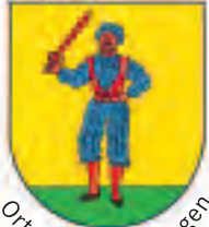
Ortsteil Bad Bellingen