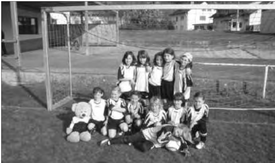
E-2-Juniorinnen der SPVGG vor dem ersten Spiel

Hinweis: Die E- und C-Juniorinnen spie- len unter Buggingen/Seefeldern in Rhein- weiler. Gez. Armin Held