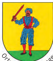
Ortsteil Bad Bellingen