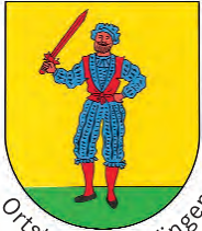
Ortsteil Bad Bellingen