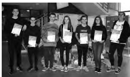
Die Absolventen des EuroBors-Praktikums 2017 mit den Sprachenpässen

bietet sie außergewöhnliche Einblicke in das Leben und die Berufspraxis des Nachbarlandes – und erhöht damit auch die Berufschancen der Absolventen der Mathias-von-Neuenburg Realschule, denn bei vielen Arbeitgebern in der Grenzregion sind gute Kenntnisse im Französischen ein wichtiges Einstellungskriterium. Abgesehen von dem BiEn-Zertifikat wird die Teilnahme an diesem EuroBors-Praktikum (Europäisches Berufspraktikum in der Realschule) noch mit dem Europäischen Sprachenpass (EuroPass) honoriert, der die besonderen Qualifikationen der Teilnehmer/innen beschreibt und europaweit anerkannt ist – auch er ist ein Plus in jeder Bewerbungsmappe.