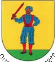
Ortsteil Bad Bellingen