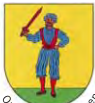
Ortsteil Bad Bellingen