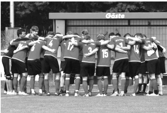
VfR Bad Bellingen: Einer für alle, alle für einen“