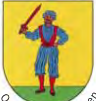
Ortsteil Bad Bellingen