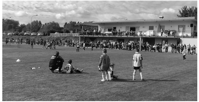
Viele Zuschauer verfolgten die Spiele