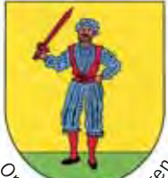
Ortsteil Bad Bellingen