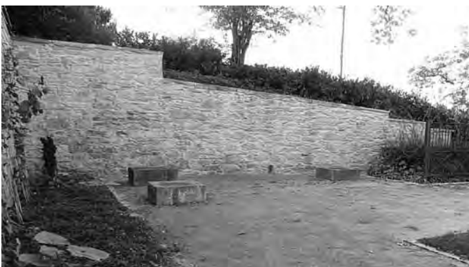
Die fertig verputzte Bruchsteinmauer

Die Mauer diente schon beim Sommernachtskonzert des Musikvereins Bad Bellingen am 22. Juni 2018 als optisch ansprechender Hintergrund.