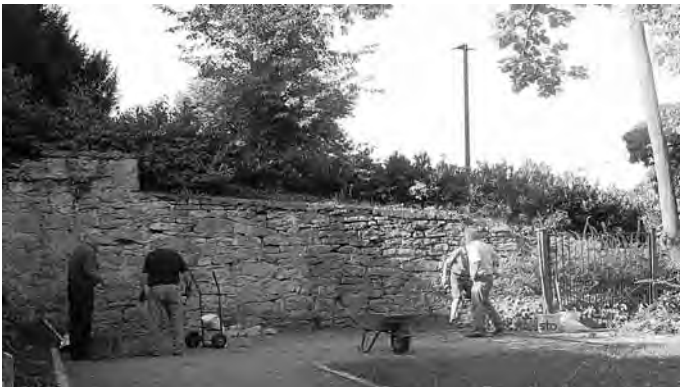
Letzte Säuberungsarbeiten am 12. Mai 2018