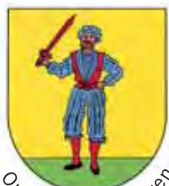
Ortsteil Bad Bellingen