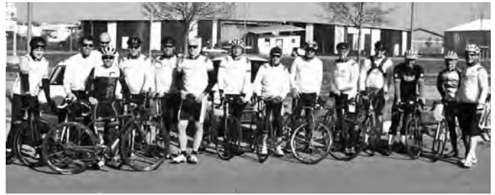
Verein gemeinsame Ausfahrten an. Start ist jeweils an der Halle in Bamlach. Da die Strecken beschrieben werden, kann auch unterwegs „eingestiegen“ werden. Alle Infos auf rv-bamlach.de .

F-Junioren Die F-Junioren trainieren wöchentlich am Donnerstag ab 17.00 Uhr auf dem Kunstrasenplatz