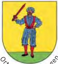
Ortsteil Bad Bellingen