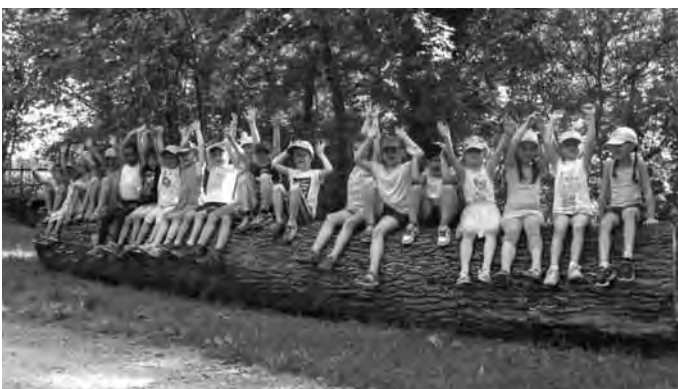
Es war ein toller Ausflug! die Schulanfänger & Erzieherinnen der Kita Farbeninsel

Wir danken den Gärtnern des Bauhofs für die Vorbereitung des Rasens und das Aufstellen der Wassersprenger und den Technikern des BUK für das Anschalten der Wasserfontänen.