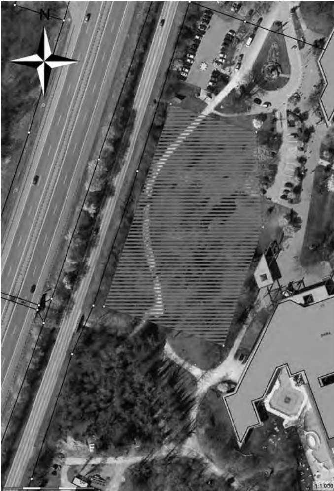
Luftbild: Grundstück (schraffiert)

Insgesamt also noch ein langer Weg. Der erste Schritt hin zu einer deutlichen Aufwertung des Kurgebiets ist nun getan.