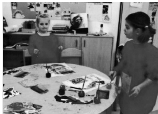
Kaffee und Kuchen