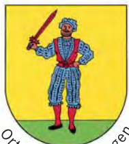
Ortsteil Bad Bellingen

Herausgeber: Bürgermeisteramt Bad Bellingen · Verantwortlich für den amtlichen Teil: Bürgermeister Dr. Carsten Vogelpohl, Telefon 07635 8119-0, Fax 07635 8119-39. Die Gemeinde behält sich als Herausgeberin die Nichtveröffentlichung von nichtamtlichen Beiträgen oder deren Kürzung vor. Verantwortlich für den Druck, Verlag und Anzeigenteil: Druckerei Aug. Schmidt, Inh. B. Schmidt, Müllheim, Telefon 07631 2770, Fax 07631 2753, E-Mail: druckerei-schmidt@gmx.de M 21 498 C