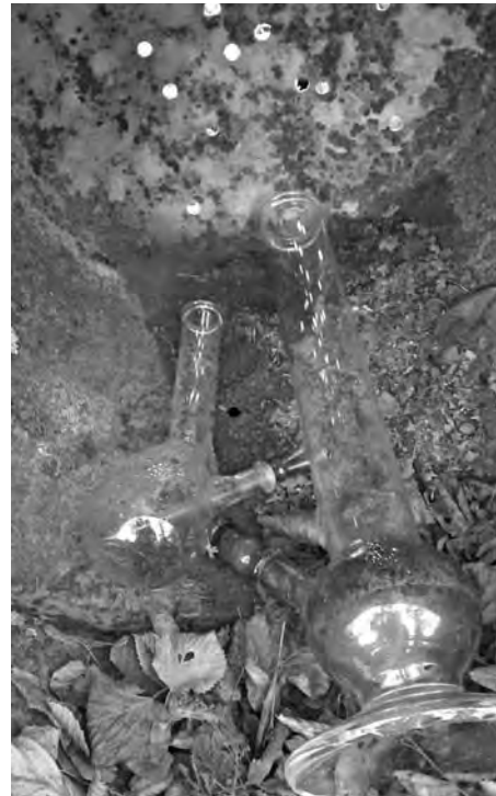
Bild) sichergestellt, die zum Konsum von Cannabis benutzt werden. Die Polizei nahm die Ermittlungen auf und kündigte häufigere Kontrollen an. Hinweise auf die Verursacher können bei der Polizei oder im Bürgermeisteramt (Tel.: 811929) abgegeben werden.

In letzter Zeit kam es häufiger zu Beschwerden über Ruhestörungen und Verunreinigungen am Spielplatz Hertingen. Zwischenzeitlich hat die Polizei vor Ort zwei sogenannte „Bongs“ (s.