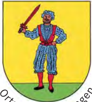
Ortsteil Bad Bellingen