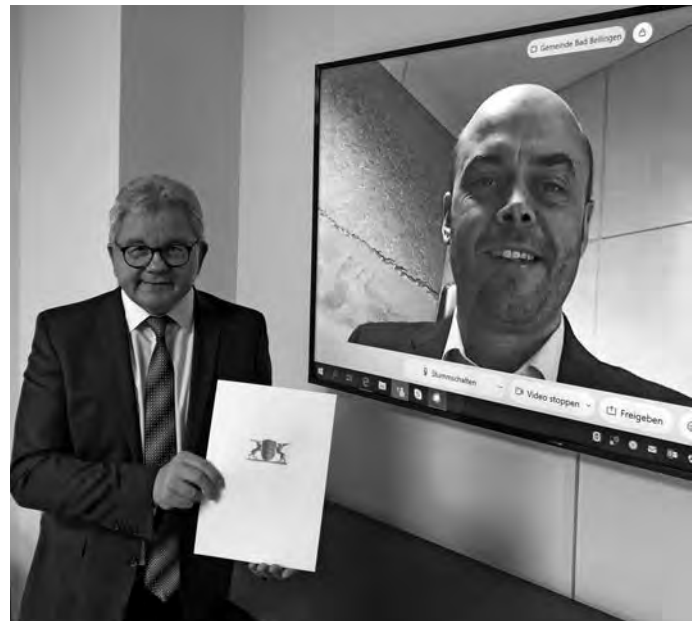
Tourismusminister Guido Wolf bei der virtuellen Übergabe des Förderungsbescheids an Bürgermeister Dr. Carsten Vogelpohl.

Die Heilbäder und Kurorte in Baden-Württemberg sind für den Tourismus im Land von großer Bedeutung. Sie erwirtschafteten in Baden-Württemberg bis 2019 jährlich einen Bruttoumsatz von rund 3,5 Milliarden Euro. Die Heilbäder und Kurorte sind in besonderem Maße von den Einschränkungen durch die Corona-Pandemie betroffen. Dem will das Tourismusministerium mit einem Investitionsprogramm „Heilbäder“ mit einem Volumen von mehr als 15 Millionen Euro begegnen: Als eine Maßnahme stellt die Landesregierung durch das Tourismusministerium 15 Millionen Euro als Stabilisierungshilfe für die Thermen und Mineralbäder betreibenden Kommunen zur Verfügung. Diese sind zunächst auf die Verluste im Zeitraum von März bis September 2020 ausgerichtet (da für die Zeit ab November der Bund eigene Hilfen für die betroffenen Branchen angekündigt hat). Die Kommunen können bei Vorliegen der entsprechenden Voraussetzungen Stabilisierungshilfen von jeweils bis zu 800.000 Euro erhalten. Es wurden bislang insgesamt 23 Anträge von antragsberechtigten Kommunen eingereicht. Es konnten bislang 15 Anträge mit einem Bewilligungsvolumen von rund 9 Millionen Euro bewilligt werden. Zudem fördert das Tourismusministerium eine Marketingkampagne der Heilbäder und Kurorte Marketing Baden-Württemberg GmbH (HKM) unmittelbar für die Zeit des Wiederanlaufens nach dem Lockdown mit 300.000 Euro. Diese Kampagne zielt insbesondere auf Gäste aus den unmittelbaren Nachbarländern Schweiz und Frankreich (dort insbesondere Elsass) ab.