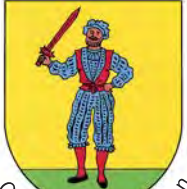
Ortsteil Bad Bellingen