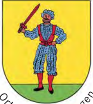
Ortsteil Bad Bellingen