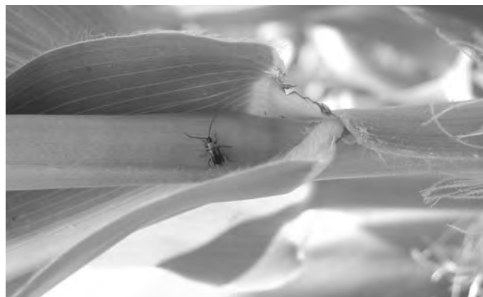
Maiswurzelbohrer im Käferstadium.

Die Allgemeinverfügung ist unter www.loerrach-landkreis.de/bekanntmachungen abrufbar.