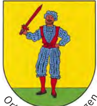
Ortsteil Bad Bellingen