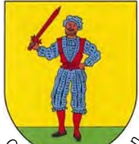
Ortsteil Bad Bellingen