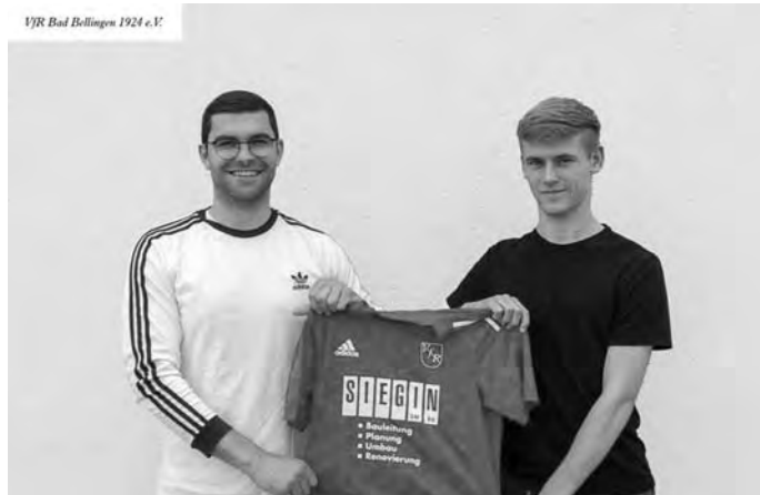
VfR Bad Bellingen 1924 e.V.