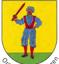
Ortsteil Bad Bellingen