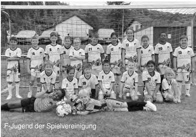
F-Jugend der Spielvereinigung

Höhepunkt der Jugendspiele war dann das Derby der A-Jugend SG Schliengen-Bamlach gegen die B-Jugend SG Rheinweiler-Neuenburg. Die jüngere Truppe hielt glänzend mit und erst gegen Ende der Begegnung konnte die A-Jugend doch noch auf 6:3 davonziehen und den internen Kräftevergleich für sich entscheiden. Am Samstagabend stand dann das Dorfderby mit den Mannschaften der Ortsteile Hertingen, Bamlach und Rheinweiler an. Vor vielen johlenden Zuschauern spielten zunächst die Teams aus Hertingen und Rheinweiler 2:2 Unentschieden. Anschließend gewann Hertingen mit 8:0 gegen Bamlach und Rheinweiler mit 7:0 gegen Bamlach. Somit hatte Hertingen am Ende die Nase leicht vorn und gewann das Ortsteiletturnier vor Rheinweiler und Bamlach. Der Spaß stand wie immer im Vordergrund und nach Abpfiff wurde noch lange gefeiert. Im Anschluss spielte die Band „Rock-Fever“ aus Rheinweiler zur Unterhaltung auf und sorgte rund um die Bar und dem Bierbrunnen für Stimmung. Es wurde noch lange gefeiert, sodass das Vorstandsteam der Spielvereinigung um Chef Patric Dosenbach ein positives Fazit über die gelungene Veranstaltung ziehen konnte.