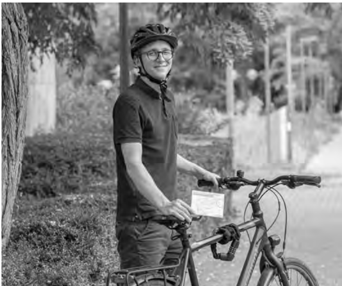
Stadtradeln mit Stempelkarte macht gleich doppelt so viel Spaß.

STADTRADELN ist eine 2008 gegründete Kampagne des Klima-Bündnis, einem Netzwerk europäischer Kommunen. In Baden-Württemberg wird das STADTRADELN durch die Initiative RadKULTUR des Ministeriums für Verkehr Baden-Württemberg gefördert.