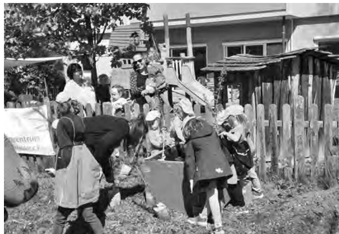
Kinder bei der Werkstattaktion „Wald und Wiese“

In der inklusiven Werkstatt „Zwischen Kunst und KiSEL“ wurden Fahnen gestaltet zum Kinderrechte-Artikel 2 (Gleichheit) und Artikel 30 (Recht auf Schutz als Minderheit). Mit „Farbe und Action“ entstanden Graffiti-Kunstwerke für die Bahnhofsunterführung in Rheinfelden. Das Recht auf Leben im Artikel 6 wurde vermittelt bei der Werkstatt „Wald und Wiese“. Der Kinderrechte-Wald wächst und gedeiht nun beim Campus. Kinder können hier Zettel mit ihren Ideen zum Thema Leben und Wachsen aufhängen. Geschmiedet wurde zu den Artikeln 38 (Schutz von Kindern im Krieg) und Artikel 22 (Schutz von geflüchteten Kindern) in der Werkstatt „Feuer und Eisen“. Das Recht auf Spiel und Freizeit in Artikel 31 und das Recht auf Beteiligung in Artikel 12, konnten die Kinder auf dem Meraner Spielplatz in Hertlen erleben. Bei „Kunst ohne Dach“ entstand eine tolle Wasserspiellandschaft. Mit „Alles unter Strom“ entstand ein Spielhäuschen zu den Artikeln 28 (Recht auf Bildung) und 13 (Recht auf freie Meinungsäußerung). Hier kann man einen Globus auf dem Dach per Knopfdruck zum Drehen bringen, bei einer Rätselfel mit raten sowie Witze und Zungenbrecher anhören.