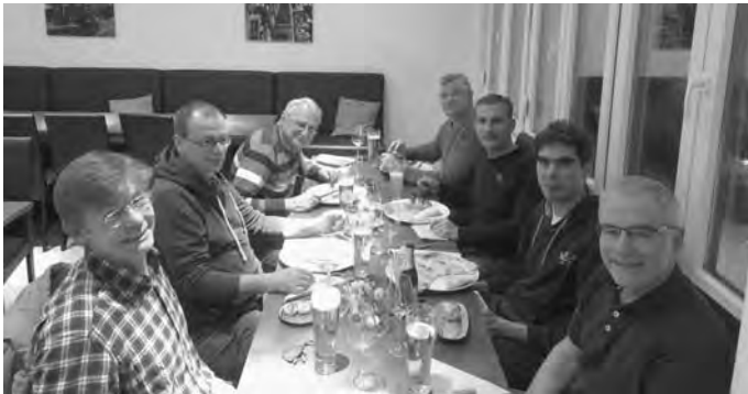
Jedermänner nach dem Sport in gemütlicher Runde

Weder zu alt noch zu jung?! Beim Jedermann-Sport kann jedermann seinen „inneren und äußeren Helden“ wieder entdecken, fördern oder in Form halten. Wir bieten dazu immer freitags zwischen 20.00 bis 22.00 Uhr ein sportlich vielseitiges Betätigungsfeld in der Sporthalle Rheinweiler. In der Regel umfasst dies: Kurzes Warmlaufen, Gymnastikübungen, Zirkeltraining und danach unterschiedliche Ballspiele. Natürlich kommen anschließendes Zusammenhocken und Plauschen gelegentlich auch auf unsere Agenda. Jedermann darf zu jeder Zeit gerne bei uns reinschnuppern oder einfach spontan mitmachen. Wir freuen uns sehr auf die Bereicherung durch dein „Mitsportlern“. Kontakt und weitere Infos bei: rolf@tv-rheinweiler.com